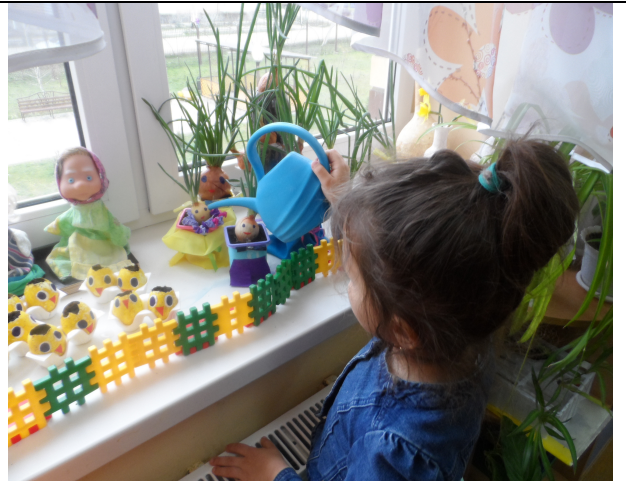
Уход за растениями.